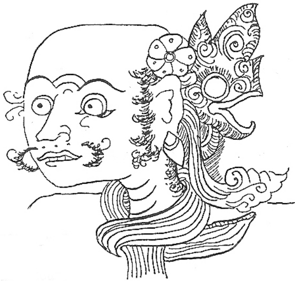
assistent, oudere man