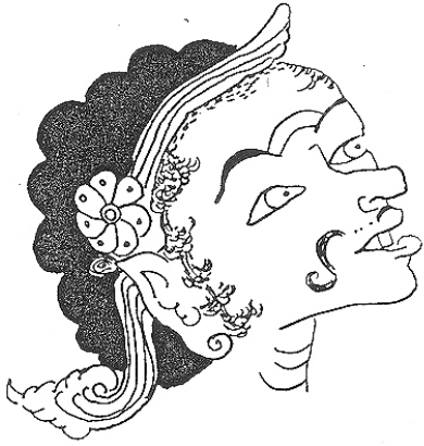
figuur van lage stand